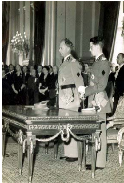
- 1958: Expo 58